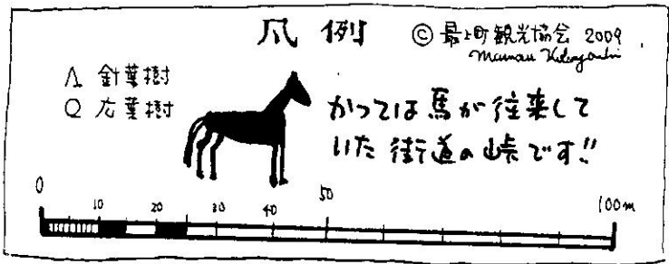
山形県最上郡最上町満沢～尾花沢